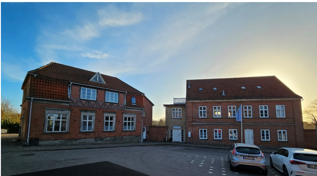
Kursusstedet set fra parkeringspladsen på Kirketorvet ved siden af kirken.

Kursusstedet præsenteres her med foto på KDPraksis hjemmeside: https://kdpraksis.dk/kursussted/