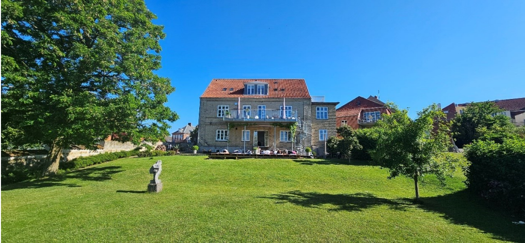
Kursusstedet set fra haven og Kirkeengen i centrum af Vordingborg.

I alle lokalerne er der adgang til internet via fastnet/kabel og via WIFI. Via husets netværk er der adgang til 2 printere. De studerende kan tilkoble egne pc'er, tablets, mobiltelefoner til internettet.